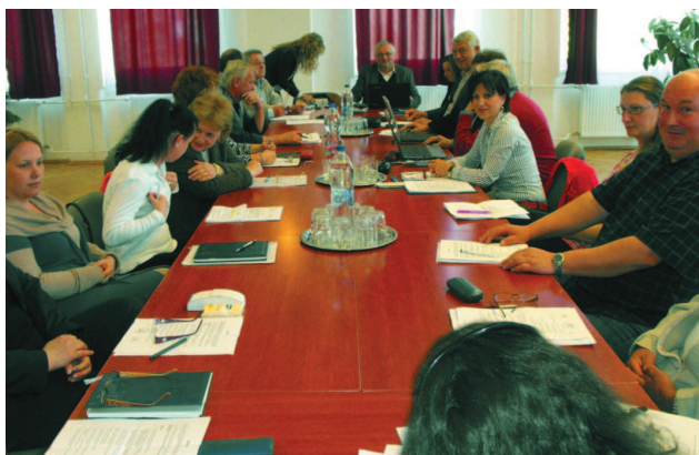
folytatás a 2. oldalon

A dokumentum részletesen elemzi a demográfiai viszonyokat, meghatározza az intézmények, a gazdaság, az infrastruktúra, az önkormányzati gazdálkodásán át, a folyamatban lévő beruházások állását.