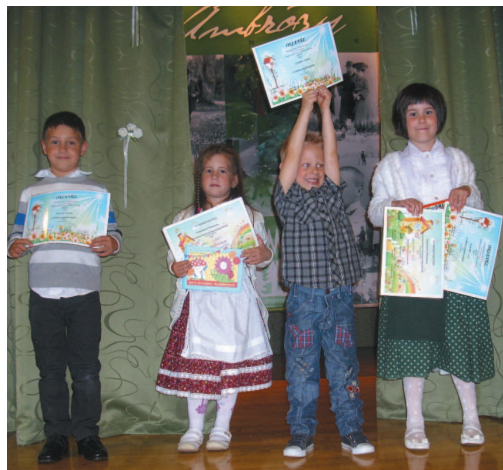
Vépi Vadvirág Művészeti Óvoda